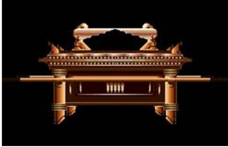
ហិបរបស់ព្រះជាម្ចាស់នៅក្នុងទី បរិសុទ្ធបំផុត