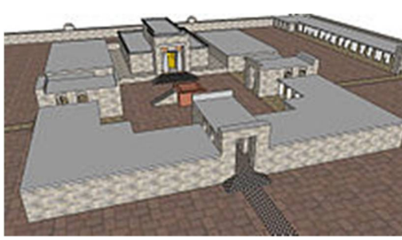
ព្រះវិហារនាឡូម៉ូនគឺជាទីបរិសុទ្ធ