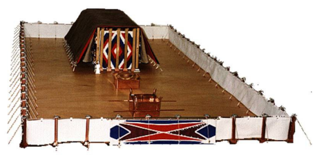
រោងឧបោសថគឺជាទីបរិសុទ្ធ

ដោយសារស្ថានភាពនេះ ព្រះជាម្ចាស់បានប្រកាសព្រះបន្ទូលទ្រង់តាមរយៈ ពួក ហោរាថា ទ្រង់នឹងធ្វើអ្វីៗទាំងអស់ទៅជាថ្មោងថ្មីតាមរយៈព្រះម៉ែស៊ីដែលព្រះអង្គនឹង ចាត់ឲ្យមក។